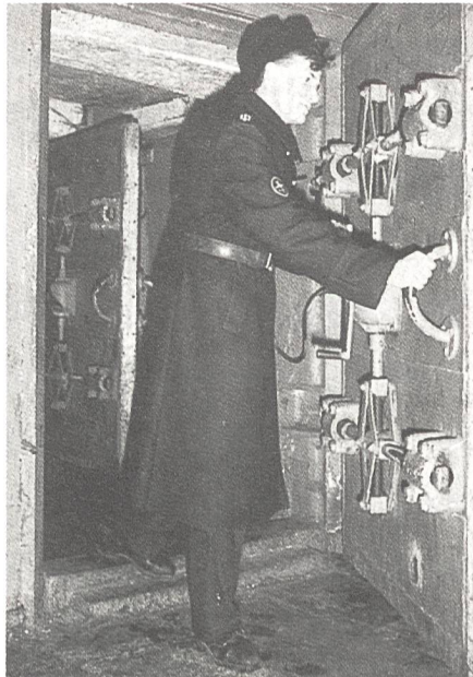
Ein besonders gesicherter Eingang zur unterirdischen strategischen Kommandozentrale des Kernwaffenstützpunkts Nerpischje in Russland.

Eine Schwalbe macht noch keinen Sommer, und über Befragungen kann man in guten Treuen verschiedener Meinung sein. Aber offenbar dämmert es doch manchem Schweizer und mancher Schweizerin allmählich, dass