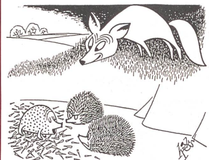
«Ich lehne Stacheln ab, sie provozieren nur!»