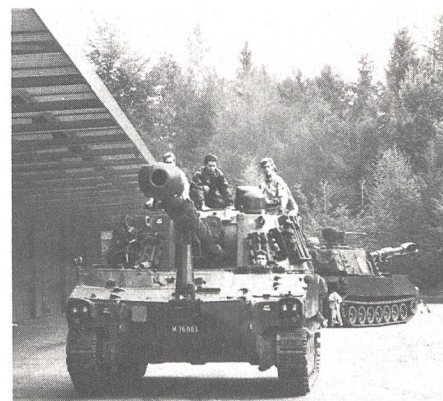
Auf dem M 109 mitzufahren, ein Erlebnis, das man nicht so schnell vergessen wird ...

Nach längerem Ausharren ging es doch noch los, und die erste Pz Hb schoss ihr 43-kg-Geschoss in ein