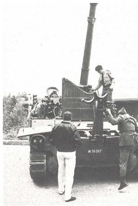
60 Angehörige des LKUOV wurden in die Geheimnisse der Pz Hb M 109 eingeweiht.