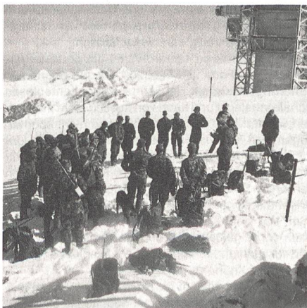
Orientierung auf dem Titlis vor dem 100-Kilometermarsch, mit dem Ziel Signau im Emmental.

wald oberhalb des Dorfes Buochs bezogen sie, von Wangen herkommend, Biwak. Zum Beginn räumten sie drei Bunkerruinen aus dem Zweiten Weltkrieg, in unmittelbarer Nähe des Sees, weg. Mit Pressluft-hämmern und Mithilfe durch einen Zug Luftschutz-Rekruten rückten die Offiziers-Aspiranten den Betonbunkern zu Leibe. Um die Beweglichkeit der Truppe zu testen, hatten sie auch Spontaneinsätze zu leisten.