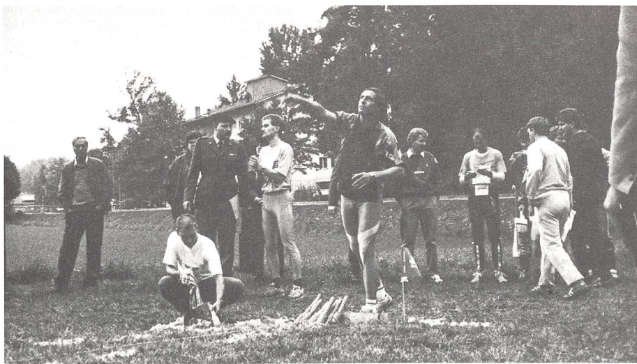
Die Wettkämpfer des UOV Büren in vollem Einsatz am Berner Dreikampf.

schossenen Resultate zeigt, dass die Unteroffiziere auch gute Schützen sind. Natürlich gab es auch Schützen, denen die Schussabgabe nicht nach Wunsch verlief. Aber sie konnten ja die verlorenen Punkte in den nächsten zwei Disziplinen wieder gutmachen. Die zweite Wettkampfdisziplin, das Werfen von UWK, wurde auf einer Wiese nahe dem Wettkampfbereich ausgetragen. Leider wurde dieser Wettkampfbereich anlässlich eines Maschinistenkurses der AMP-Feuerwehr zwei Tage vor dem Wettkampf trotz der vielen Niederschläge noch künstlich bewässert und unter Wasser gesetzt. Damit war die Rutschpartie schon vorprogrammiert. Auch hier wurde nach einem zögernden Start zügig gearbeitet. An diesem Posten mussten grosse Wartezeiten in Kauf genommen werden, da eine vierte Wurfanlage mit Rücksicht auf das Kulturland und den aufgeweichten Boden nicht gebaut werden konnte. Den Besucher erstaunte die grosse Treffsicherheit der Wettkämpfer. Das OK hatte sich entschlossen, für diesen Wettkampf noch einmal den HG-43-Wurfkörper zu benutzen. Für viele Wettkämpfer war das ein Nachteil, für viele aber ein Vorteil.