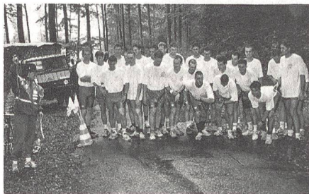
Vreni Schneider (links) gab in Buochs den Startschuss zum Berglauf aufs Buochserhorn.

Die 27 Offiziers-Aspiranten der Luftschutztruppen werden ihre Durchhaltewoche vom 22. bis 29. September 1993 nicht so schnell vergessen. Einerseits, weil sie mit harten Bunkerabbruch-Arbeiten in Buochs einen äusserst nahrhaften Beginn verzeichneten, andererseits auf dem 100-Kilometermarsch zwischen 2000 und 3000 Meter Höhe, in Schnee und Kälte einen weitem Härtestest zu beweisen hatten. Für einen unvergesslichen Moment sorgte Weltcupfahrerin Vreni Schneider, die in Buochs den Startschuss zum Berglauf aufs Buochserhorn erteilte. Die Durchhaltewoche der 27 Offiziers-Aspiranten der Luftschutztruppen führte die Beteiligten in die Innerschweiz unter dem Kennwort «Titlis». Im Buochser-