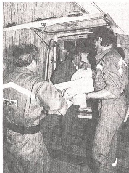
Aus Zeitschrift «Zivilschutz» 11-12/92

Risiko eines Unfalles, wie die Erfahrung zeigt, sehr gross ist. Durch diesen Denkanstoss erhofft sich die MUVK eine merkliche Verringerung der sogenannten «Routineunfälle». Als Begleitung zu den Plakaten gelangen noch Vignetten und Tischsets zum Einsatz. Die MUVK will mit der Aktion alle Angehörigen der Armee, insbesondere jedoch die Kader aller Stufen, ansprechen. Diese sind es, welche durch gezielte Einflussnahme und entsprechende Instruktion positiv auf das Unfallgeschehen einwirken können. Zusätzlich unterstützt die MUVK mit Plakaten und Vignetten die zivilen Institutionen im Kampf gegen das Drogenproblem. Im weiteren wird in den Bereichen Munitionsdienst, Gehörschutz, Blindgänger sowie Strassenverkehr und Sport Unfallprävention betrieben. Radio-Spots, diverse Werbeartikel und die Zeitung «intus» unterstützen diese Aktionen EMD-Info