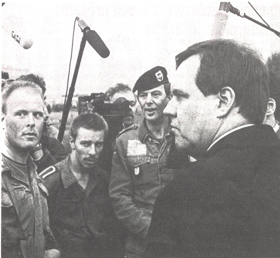
Landesverteidigung bleibt der politische Legitimationsrahmen für die Streitkräfte und die allgemeine Wehrpflicht – Verteidigungsminister Volker Rühle im Gespräch mit Soldaten in Beelitz.