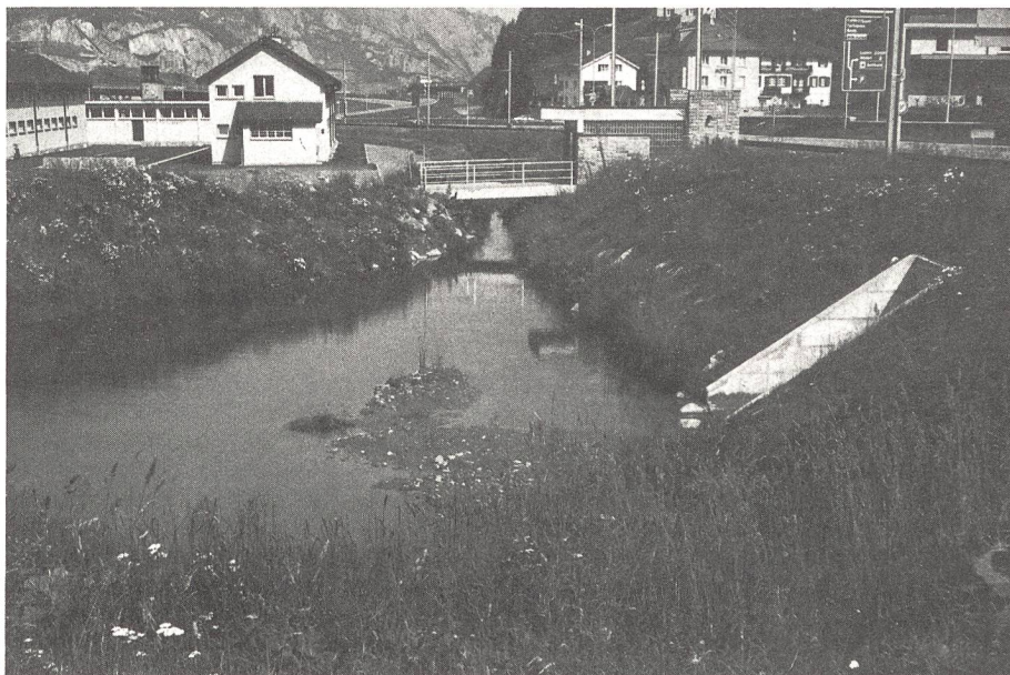
Hochwasserentlastungskanal durchs Kasernenareal.

Für die Neugestaltung des Waffenplatzes nach dem Unwetter 1987 wurde ein Wettbewerb ausgeschrieben. Das erstrangierte Projekt vom Atelier Stern und Partner aus St. Gallen verfolgte neben einer repräsentativen und aussagekräftigen Gestaltung des Kasernenplatzes die Absicht, mit diversen baulichen