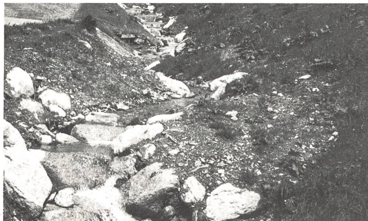
Aufnahmen vom Dürstelenbach im alten Zustand (links) und revitalisiert im rechten Bild, das heisst, im neuen Zustand.