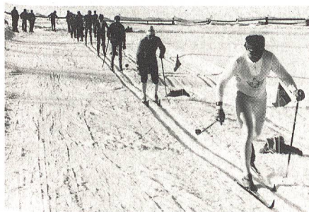
Eine Klasse startet zum Conconi-Test.