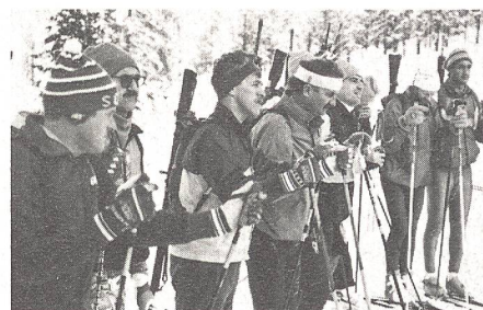
Instruktion der Klassenlehrer über das Verhalten im Patrouillenverband.

Auch dieses Jahr bildeten das Führen einer Patrouille und das konkrete und richtige Verhalten auf dem Schiessplatz für Major Otto Hugentobler die tragenden Elemente der Ausbildung. «Jeder Teilnehmer muss das Führen einer Patrouille über eine längere Distanz noch besser beherrschen», unterstrich Hugentobler, für den aber auch die Verbesserung der Kondition und der Technik im klassischen und im Skating-Bereich klare Zielsetzungen beinhalten. Von grosser Bedeutung waren für den langjährigen Kurskommandanten auch die richtigen und korrekten Bewegungsabläufe auf dem Schiessplatz. Er verlangte von seinen Leuten, dass die Forderung «3