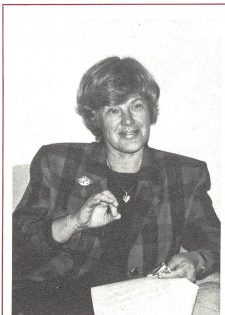
Kurzporträt von Elisabeth Rehn, finnische Verteidigungsministerin

Elisabeth Rehn: Wir arbeiten bereits unter den nordischen Ländern zusammen, das heisst