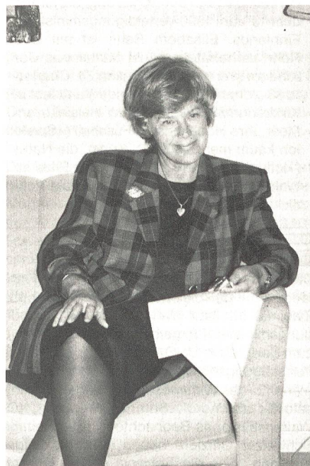
Elisabeth Rehn, die einzige Frau in Europa, die Verteidigungsministerin ist und für Finnland 64 F/A-18 einkaufte.

Elisabeth Rehn: Die beiden Pfeiler der finnischen Sicherheitspolitik sind die Aussenpolitik und die Verteidigungspolitik. Auch bei einer allfälligen politischen Annäherung an Europa wollen wir eine eigenständige Landesverteidigung aufrechterhalten. Wir verfügen über keinen mit der Schweiz vergleichbaren Zivilschutz. Hingegen ist unser Rettungsdienst gut ausgebaut.