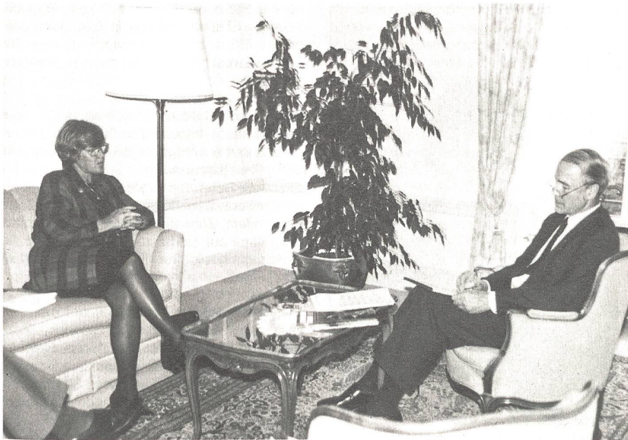
Elisabeth Rehn, finnische Verteidigungsministerin, im Gespräch mit Oberst Heinrich Wirz, Militärpublizist

Besteht in Finnland eine vergleichbare sicherheitspolitische Grundlage und wie kommt sie zustande?