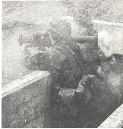
Panzerfaust-Schützentrupps nach dem Abfeuern der Panzerfaust-Hohlladungspatrone.

Die Panzerfaust ist eine tragbare, ab Schulter frei oder aufgestützt geschossene Einmann-Panzerabwehrwaffe. Sie ersetzt bei der Infanterie das Raketenrohr. Das System besteht aus dem wiederverwendbaren Abschussgerät und der Hohl-