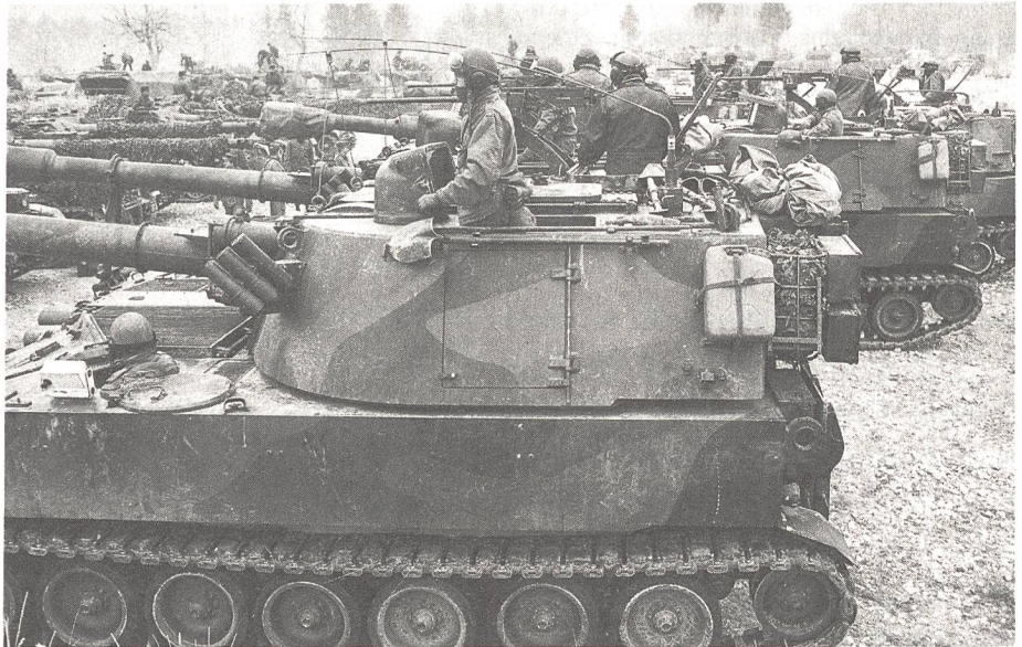
Panzerartillerie bereit zum Einsatz.

Die politischen Veränderungen in Europa führten auch zu einer veränderten sicherheitspolitischen und militärstrategischen Lage für Österreich: für den Neutralen, der bisher an der potentiellen Konfrontationslinie der beiden grossen Militärbündnisse in Euro-