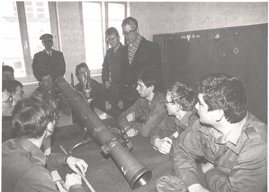
Werner Fasslabend, Verteidigungsminister, auf Besuch bei Grundwehrdienern.

Die Trennung von Ausbildungs- und Einsatzorganisation, wie sie bisher bestand, wird aufgehoben. Das ist das Resultat des geänderten Bedrohungsbildes, das die Möglichkeit eines unmittelbaren Überganges aus der Friedensorganisation in den Einsatz verlangt. Bereits in der Friedensorganisation werden deshalb kaderstarke und aufgefüllte Verbände strukturiert, die für Präsenzaufgaben ver-