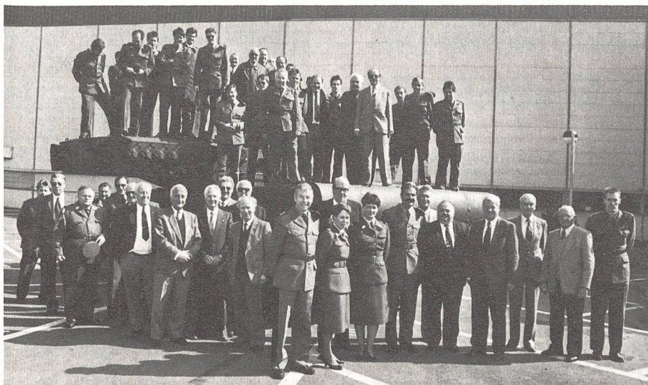
Die Unteroffiziere und Gäste der Luzerner Delegiertenversammlung auf und neben dem Leopard-Panzer.