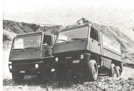
Bucher-Duro, ein in enger Zusammenarbeit mit der GRD entstandenes Universal-Trägerfahrzeug.

In der Schlussevaluation standen sich der schweizerische Duro und der deutsche Unimog der Firma Mercedes-Benz gegenüber. Beim Duro handelt es sich um eine Schweizer Entwicklung, die aufgrund eines parlamentarischen Vorstosses eingeleitet und hauptsächlich vom Militärdepartement finanziert wurde. Die Evaluation ergab, dass beide Fahrzeugtypen truppentauglich und beschaffungsreif sind. Aus militärischer, technischer und kommerzieller Sicht