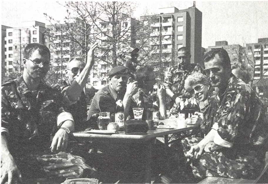
Am Zugersee-Marsch erleben die Teilnehmer Freud'...