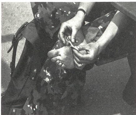
... und Leid.