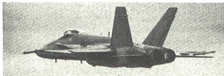
F/A-18 HORNET – ab 1996 fliegt dieser Typ neu auch bei der Schweizer Luftwaffe.

Flugzeugerkennersich kann die « Hornisse » ein harter Brocken sein. Die Maschine ähnelt von der Ausle-