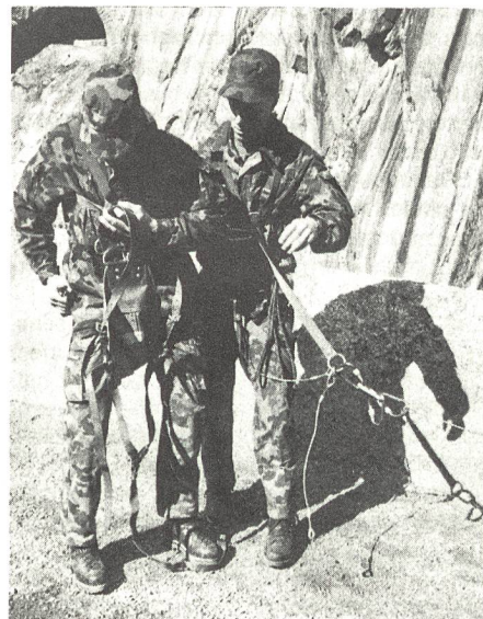
In der «Schöllenen» wurde das Anseilen eines Retters mit einem Verletzten vordemonstriert, was sich in der Höhe des Felsens tatsächlich abspielt.

an steilen Felswänden. Hier muss bedächtig und überlegt gehandelt werden. Ein falscher Griff an den Rettungsseilen kann sich für den Verunfallten wie aber auch für seinen Retter verhängnisvoll auswirken.