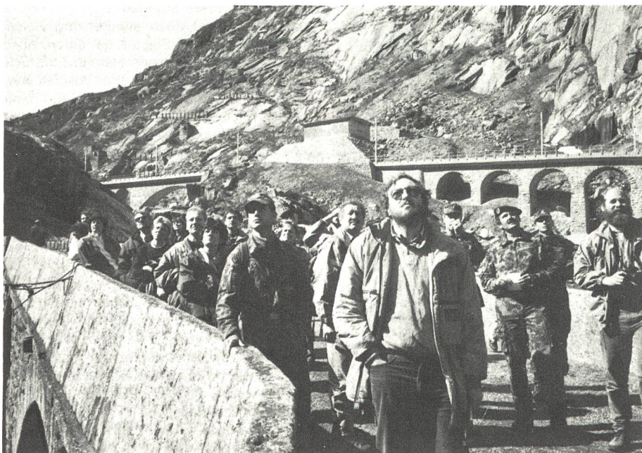
Die Medienvertreter erleben mit Spannung die Rettung eines Verletzten hoch oben im Felsen.

Wie sich das Zusammenspiel zwischen militärischen Helfern und zivilen Rettern auswirkt,