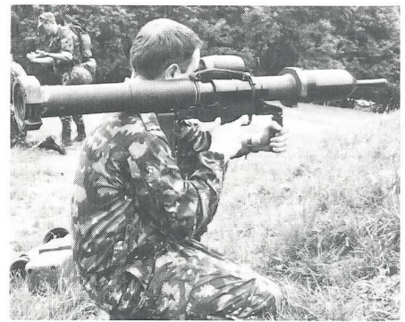
Anschlag kniend frei.

Nach der Stärkung mit Tee und «Militärguezli» aus der Küche der Rdf Kp I/6 volle Konzentration. Je zwei Mann bilden ein Trupp, ausgerüstet mit zwei PzF mit Einsatzlauf und einem Abschussgerät. Der Einsatzlauf ist in bezug auf Form, Gewicht und Schwerpunkt eine Nachbildung der Hohlladungspatrone. Er wird zum Munitionieren aus dem Abschussrohr herausgezogen. Die 18-mm-UPat Lsp (Übungspatrone