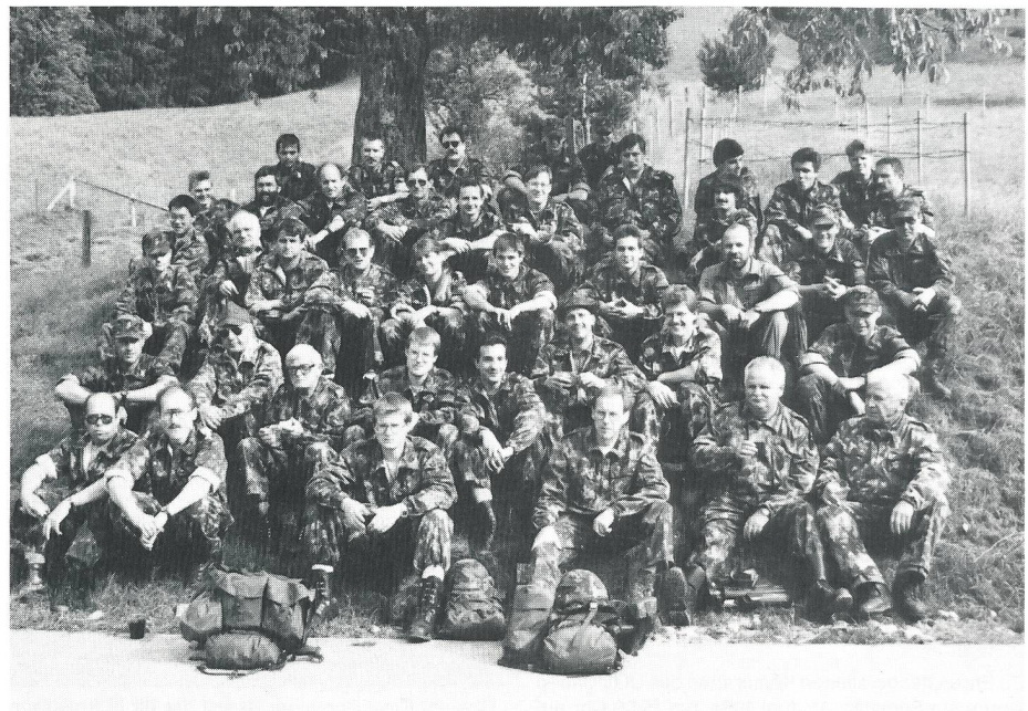
Der KUOV Zürich-Schaffhausen an der Kaderübung «Panzerfaust».

Nach 20 Jahren Planung und fünfjähriger Bauzeit hat das Eidgenössische Militärdepartement (EMD) Anfang Juni in Zwißelberg bei Thun die Fabrikationsanlage Boden offiziell eingeweiht. Es handelt sich um eine neue hochmoderne Anlage der Munitionsfabrik Thun, die rund 53 Millionen Franken gekostet hat.