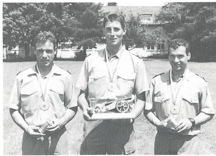
Die Sommermeister 1994 im Patrouillenwettkampf des Festungswachtkorps kommen aus dem Tessin.

Fahrrad. Wettkampfkommendant Major Gurtner sorgte mit 72 Funktionären für einen reibungslosen Ablauf dieser 9. Sommermeisterschaft der Festungswächter.