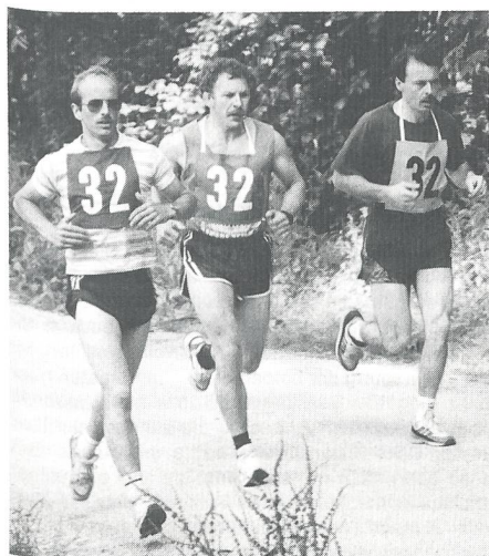
Beim 6-km-Geländelauf auf dem Bruggerberg.