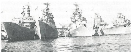
Zerstörer und Schlachtschiffe der Schwarzmeerflotte der GUS am Marinestützpunkt Sewastopol.

Offiziell geht es heute in erster Linie um die Schwarzmeerflotte und ihre Stützpunkte. Darüber wird schon lange auch auf höchster Ebene verhandelt, und das Ende dieser Verhandlungen und deren Ergebnis sind nicht absehbar, aber praktisch wäre das Problem lösbar. Schlimmer steht es mit der Zugehörigkeit der Krim bzw ihrem Verhältnis zur Ukraine und zu Russland.