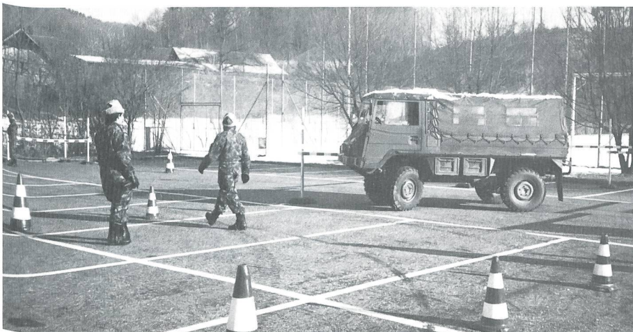
Zum Ausbildungstraining einer Strassenpolizei-UOS gehört auch das Fahrtraining.

Am Sonntagabend bezogen die UOS AdAs stillschweigend wieder ihr Quartier. Die ersten beiden Tage verbrachten wir noch im Schulzimmer, um die Theorie mit unseren männlichen Kollegen zu intensivieren.