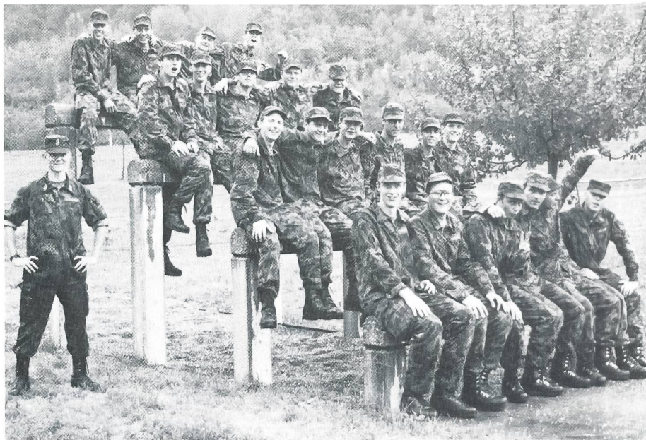
Zug Dudle als verschworene Gemeinschaft auf dem Bärentritt der Hindernisbahn

Nach 4 Wochen UOS freuten wir uns, endlich unsere Rekruten zu sehen, obwohl die Ausbildung noch 2 Wochen weiterlief. In dieser Zeit beobachteten sich Rekruten und Korporäle aus der Distanz sehr genau. Die ersten 2 Wochen RS erlebten wir nur am Rande mit. Wir sahen die Zugführer mit den Rekruten beim HV, bei der Zugsschule, der formellen Ausbildung, der Grundausbildung am Sturmgewehr, beim Schiessen und beim PD. Im allgemeinen fiel uns auf, dass der Leutnant mit rund 30 Rekruten eine zu grosse Gruppe hatte, um sorgfältig und effizient arbeiten zu können. Bei der Grundausbildung am Sturmge-