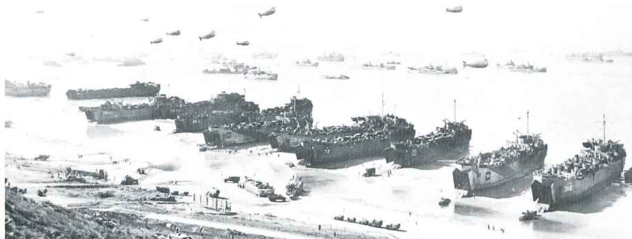
Panzerlandungsschiffe werden im den Amerikanern zugeteilten Omaha-Abschnitt an der Küste der Normandie entladen.

1938 wurde zum erstenmal ein Panzer von einem Boot aus gelandet. Erst 1939 kam jedoch die Verwendung von Landungsbooten bei der US-Navy endgültig aus dem Probestadium heraus, als ein vom Bootsbauer Andrew