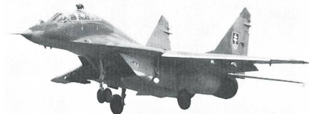
MiG-29 FULCRUM, Slowakei