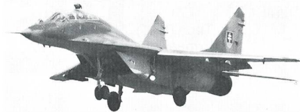
MiG-29 FULCRUM, Slowakei