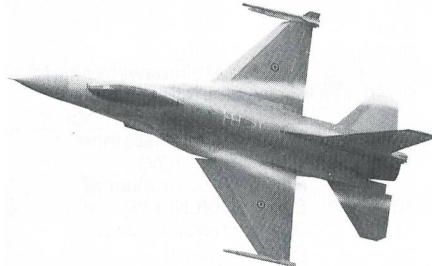
F-16 FIGHTING FALCON, Belgien