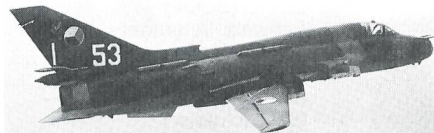
SU-22 FITTER, Tschechien