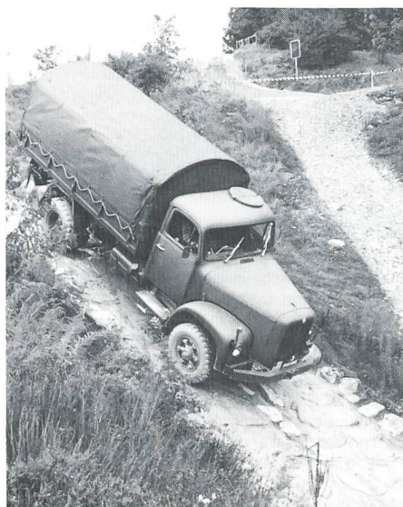
Wettkämpfer mit 2 DM auf dem Parcours.

Nach dem Mittagessen hatten die Gäste noch genügend Zeit, um sich auf der Übungsanlage umzusehen. Nicht nur die grosse Fahrzeugausstellung vom Oldtimer bis zum 10 DM liess die Herzen der «Wägeler» höher schlagen. Auch die computerunterstützte Ausbildung am Bildschirm war hochinteressant und