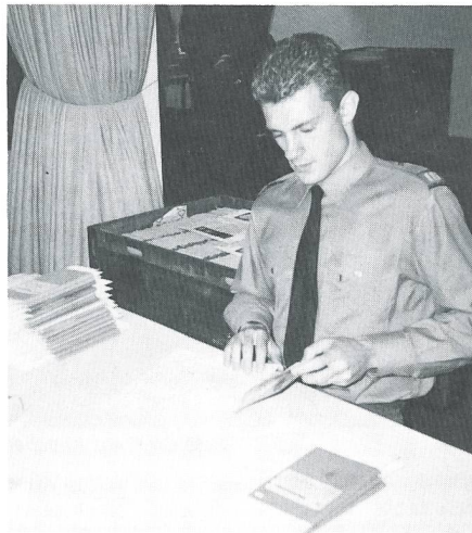
Letzte Kontrolle der DB.

Am PC muss lediglich die AHV-Nummer eingegeben werden. Alle für die Bearbeitung erforderlichen Daten sind in einer besonderen Datenbank gespeichert und werden an Ort und Stelle auf Selbstklebe-Etiketten ausgedruckt.