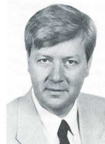
Zivile Behörden: Regierungsrat Andreas Koellreuter, Militärdirektor des Kantons Basel-Landschaft

Der Kanton Luzern hat eine Stabsstelle für Katastrophenhilfe/Gesamtverteidigung (vor Mobilmachung) sowie einen kantonalen Notstandsstab (nach Mobilmachung). Ihre Aufgaben sind: Begehren beurteilen und über Weiterbearbeitung entscheiden (ablehnen, ergänzen), Einsatzregelung und -überwachung. Grundsatzentscheide werden durch den Departementschef oder die Gesamtregierung gefällt.