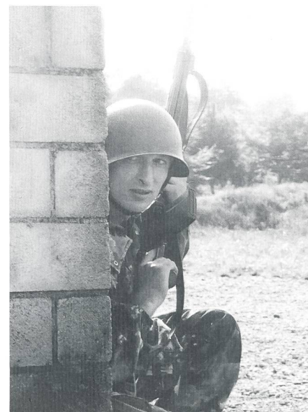
Der Erfolg im Ortskampf ... die Beobachtung.

Grenadiere der Gren Kp 1/5. Ihr habt die in Euch gesteckten Ziele erreicht. Ihr habt mit