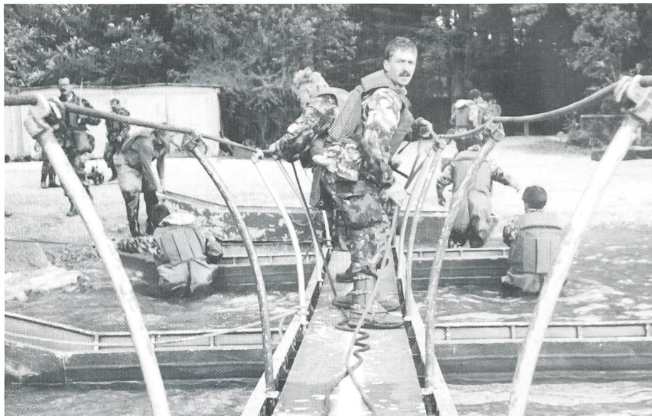
Nebst dem harten Infanteriekampf beherrschen die Grenadiere auch den Einbau des Steg 58.

Mit diesem harten Einstieg in den Alltag einer Eliteformation waren die Unteroffiziere der