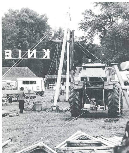
Auslageordnung und Traktoren im Einsatz.

Von Franco Knie erfuhren die Aspiranten zudem auch, dass der Nationalzirkus täglich