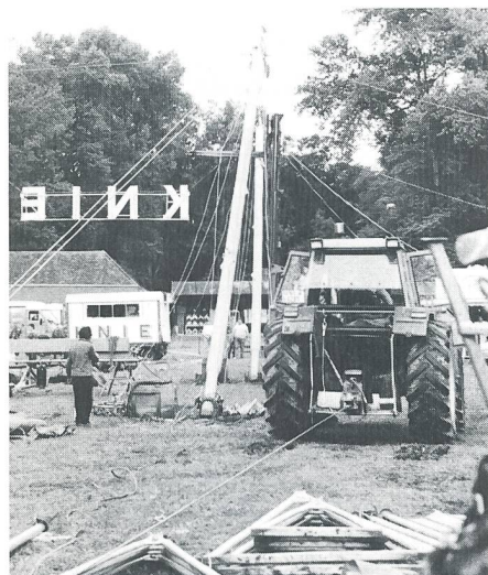
Auslageordnung und Traktoren im Einsatz.

Von Franco Knie erfuhren die Aspiranten zudem auch, dass der Nationalzirkus täglich