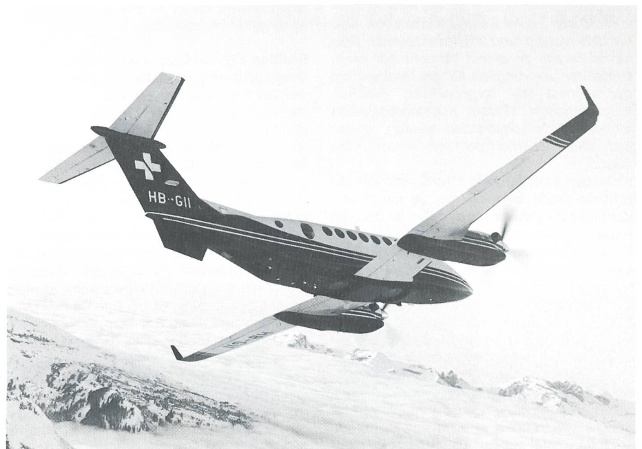
Neues Vermessungsflugzeug Super King Air 3500 HB-G11 vor den Churfürsten. Auf der Unterseite des Rumpfs sind die Kamerasysteme eingebaut.

Besitzerin des Flugzeuges ist das BA L+T, welches zum Eidg Militärdepartement gehört. Die hochqualifizierte Besatzung des Super King Air rekrutiert sich aus dem Überwa-