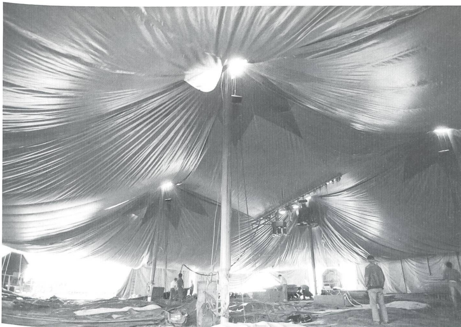
Das 3000 Personen fassende Zelt stellen 28 Mitarbeiter des Circus Knie in vier bis maximal sechs Stunden bezugsbereit auf.

Schweiz rund 235 Abend- und 140 Nachmittagsvorstellungen. Damit da alles rund läuft, braucht es eine Top-Organisation. Knie hat sie. Die Genie-OS 2/93 durfte «hineinschauen».