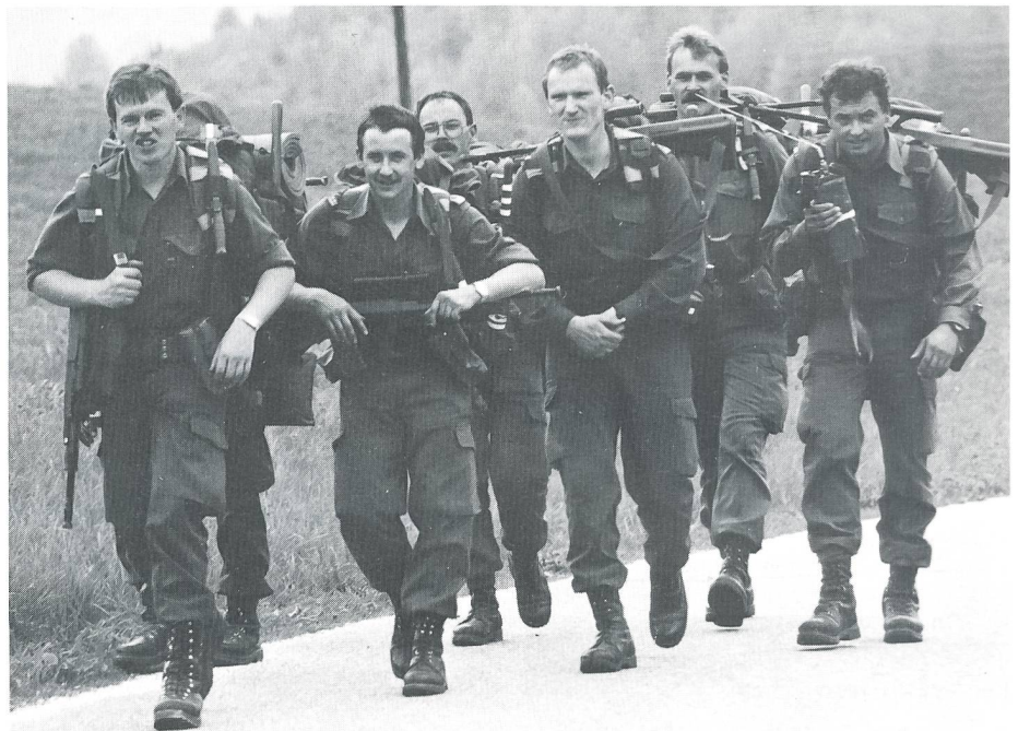
Das psychische Umfeld soll verbessert werden. Dies bei der Ausbildung und auch ganz generell.

Deshalb soll die wehrpädagogische Schulung aller Funktionsträger intensiviert werden, aber auch die Qualität der gesamten militärischen Ausbildung durch eine dienstrechtliche Besserstellung anerkannt werden. Die Militärakademie soll den Status einer «Fachhochschule» erlangen, und die Heeresunter-