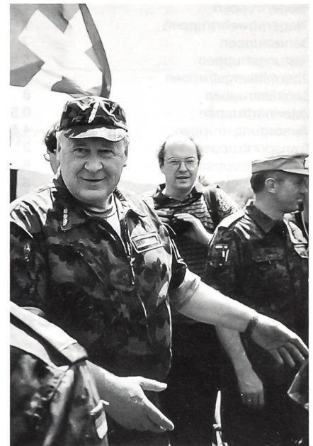
Der Generalstabschef der Schweizer Armee, KKdt Arthur Liener, beurteilt die Arbeit der Truppe beim Brückenschlag.

Im Zusammenhang mit einer optimalen Nutzung der knappen Ausbildungszeiten in der Armee 95 bleibt zu hoffen, dass derartige