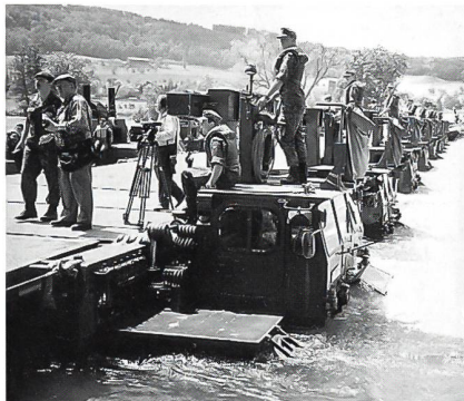
Gemeinsame Kriegsbrücke aus Amphibien M2 (Vordergrund) und Schlauchbootbrücke 61 (Hintergrund).

Das Pontonierbataillon 26 baute zuerst die Schlauchbootbrücke 61 bis zur Flussmitte. In-nerst 30 Minuten wurden die deutschen Amphibien-Brückenteile gewässert, zusammengebaut, eingefahren und in Flussmitte mit der Schlauchbootbrücke 61 zusammengeschlossen. Da die Fahrbahnhöhe der Schlauchbootbrücke 61 mit 1,20 m über Wasseroberfläche um 60 cm höher als die des deutschen Systems liegt, musste mit einem behelfsmässigen Übergangsstück die Niveaudifferenz ausgeglichen werden. Der grenzüberschreitende Brückenschlag wurde durch Handschlag des Generalstabschefs und des Generalinspektors freigegeben. Neptun erwies dem gemeinsamen, erst- und wahrscheinlich einmaligen Bauwerk seine Reverenz und kredenzte den hohen Militärs sein köstliches Rheinwasser und verschwand wieder in den Fluten des Rheins. Es folgte die Überfahrt von Sanitätsfahrzeugkolonnen der Bundeswehr zur Übernahme