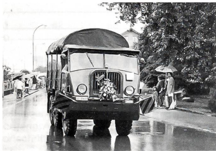
Der UOV Amt Hochdorf zeigte am Festumzug unter anderem einen restaurierten Saurer-Lastwagen 6x6 aus dem Jahre 1940.

Wer hätte wohl zu glauben gedacht, dass die Schweizer Armee in den letzten Jahren so viele verschiedene Fahrzeuge im Einsatz hatte? Die Älteren eher schon, aber die Jüngeren, die gerade noch den Pinzgauer oder den neuen Puch-Geländewagen kennen, eher nicht. Der Festumzug wurde unter dem Motto «Musik und Brauchtum» durchgeführt. Der Unteroffiziersverein Amt Hochdorf als ortsansässiger Verein liess sich die Gelegenheit nicht entgehen, um