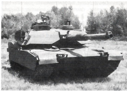
Als eines der ersten Waffensysteme soll der «Abrams» M-1A2 mit dem neuen Wärmebildsystem ausgerüstet werden.

Eine Armee wie die US-Armee muss laufend auf modernem Stand gehalten werden, die Kürzung des Wehrbudgets zwingt sie aber, effiziente Rüstungsgüter kostengünstiger zu beschaffen. Ein neuer Weg ist die sogenannte horizontale Technologie-Integration. Darunter versteht man die Bemühungen, bei verschiedenen Waffensystemen für ähnliche Anwendungen dieselben Gerätetypen einzusetzen. Der Erfolg liegt auf der Hand: kostengünstigere Beschaffung bei grosser Gerätestückzahl sowie geringere Erhaltungskosten dank vereinfachter Logistik. Bei der US-Armee laufen zurzeit drei Horizontale Technologie-Integration-(HTI-)Programme: ● Wärmebildgerät der zweiten Generation; ● Gefechtsfeld-Digitalisierung; ● Freund-Feind-Kennung am Gefechtsfeld. Vom Pentagon wurde im Februar 1993 eine spezielle Projekt-Arbeitsgruppe eingesetzt. Jede Dienststelle in der US-Armee, die mit Nachsicht zu tun hat, ist in dieser sogenannten «Task-Force» vertreten. Geplant ist die Realisierung von zwei Gerätekomponenten. «Kit-B» ist dabei das eigentliche, universelle Wärmebildsystem der zweiten Generation. «Kit-A» hingegen umfasst die individuellen Schnittstellen-Subsysteme zu den entsprechenden Waffensystemen. Dabei muss die mechanische, elektrische und elektronische Anpassung berücksichtigt werden.