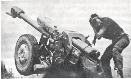
Ein Soldat der bosnischen Regierungstruppen feuert während der Kampfhandlungen der letzten Zeit mit einer 122-mm-Haubitze auf eine serbische Artillerieposition in der Nähe von Travnik.

dem erneuten Ausbruch der Kämpfe eine Blauhelm-Aktion schwierig geworden ist, wenn ein klarer politischer Wille fehlt. Um so weniger ist auch von der neuen schnellen Eingreiftruppe der UNO ein Wunder zu erwarten.