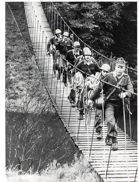
Ungarische Honvéd bei einem Gewaltmarsch.

Die prekäre finanzielle Lage der ungarischen Regierung zwang das ungarische Verteidigungsministe-