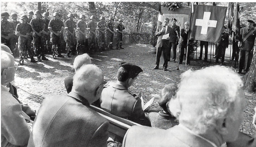
Von rechts: Fahnendelegation, Soldatendenkmal, Fahnenzug der Vsg Trp RS 273 in Bern.