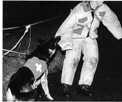
Wenn der Schäferhund zubeisst, gibt es kein Entrinnen mehr.

Die Mitglieder der Unteroffiziersvereine hatten nun die Aufgabe, unter Einbezug der Natur die Hunde und ihre Führer zu überlisten und das Objekt in zwei Phasen anzugreifen. In drei Gruppen machten sie sich auf den Weg, um in der Nacht das Gelände und das Objekt zu erkunden. Zwei der drei Gruppen waren erfolgreich und konnten an der anschliessenden taktischen Sitzung ein strategisches Vorgehen planen. Die andere Gruppe wurde kurz vor dem Ziel von der Hundeführergruppe erkannt und überwältigt. In einer zweiten Phase wurden die Helfer mit Spezialkleidern ausgestattet, damit die Hunde ihr Können beim Beissen unter Beweis stellen konnten. Ein