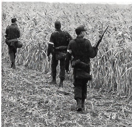
Fussstreifen bei der Überwachung des Grenzgeländes.

Seit fünf Jahren leistet das Bundesheer nun bereits einen Assistenzinsatz für die Bundesgendarmarie an der grünen Grenze zu Ungarn. Mehr als 100 000 Soldaten aus beinahe allen Garnisonen Österreichs haben seit September 1990 an der Grenze im Burgenland ihren Dienst versehen. Bis 25. August 1995 wurden insgesamt 23 700 illegale Grenzgänger aus 86 Staaten durch die Soldaten des