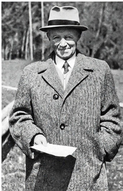
General Guisan 10 Jahre nach Kriegsende. Mit mehr als 80 Jahren immer noch jugendlich.

1939 bis 1945 eine harte, entbehrungsreiche und sorgenvolle Zeit der Bewährung. Die Schweiz stand unter schwerer militärischer Bedrohung und war in einen äusserst harten Wirtschaftskrieg verwickelt. Dessen war man sich damals wohl bewusst, dessen ist sich auch heute noch ein allerdings immer kleiner werdender Bevölkerungsanteil aus eigener Anschauung bewusst. Dankbarkeit für die Leistungen der damaligen Generation und ihrer Führer wäre allein schon ein Grund zur Rückbesinnung.