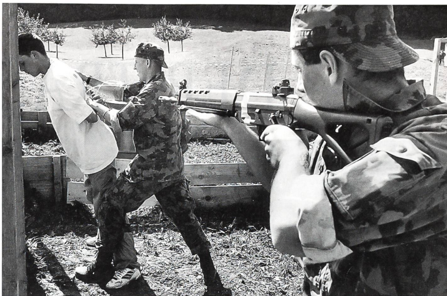
Auf die Ausbildung der Durchsuchung einer verdächtigen Person wird grosser Wert gelegt.