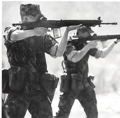
Ausbildung der neuen Gefechtsschiess-Technik

Leutnants. Was sie in den ersten drei Wochen der Rekrutenschule ohne Korporale leisten, ist beachtenswert. Sie stossen dabei zwar an die Grenze der Belastung, aber die meisten schaffen es. Chapeau!