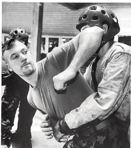
Der Nahkampf-Technik kommt eine hohe Bedeutung zu. Um Unfälle zu vermeiden, steht eine spezielle Nahkampfausrüstung (Schlagkissen/Tiefenschutz, Schutzweste und Helm) zur Verfügung.

Die Rekruten seien nach den ersten 3 Wochen ohne Korporale vielleicht etwas weniger gut ausgebildet, meinte Christen «aber sie sind motivierter». «Die Krone aber gehört den