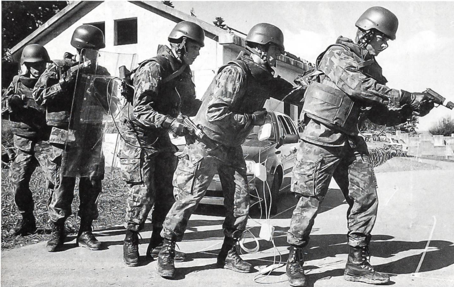
Der Einsatz der Territorialgrenadiere wurde in einer interessant angelegten Übung auf dem «Stierliberg» vordemonstriert.

Zu seinem zweiten Medientag in diesem Jahr (13. September 1995) lud der Ausbildungschef der Armee, Korpskommandant Jean-Rodolphe Christen die Vertreter der Tages- und Fachpresse ins Reppischtal ein. Zweck davon, die Medien mit einem neuen Aspekt, der Ausbildung der Territorial-Füsiliere, vertraut zu machen. Zum Einsatz kamen Angehörige der Infanterie-Rekrutenschule 206, unter dem Kommando von Oberstleutnant i Gst Marcel Fantoni plus zugezogene Territorialgrenadiere. Die Ausbildung von Territorial-Füsiliere entspreche exakt dem neuen Engagement der Armee 95, hiess es im Einladungsschreiben des Ausbildungschefs. Im Bericht 90 des Bundesrates über die Sicherheitspolitik der Schweiz wird der Beitrag zur Existenzsicherung mit militärischen Mitteln als einer der zentralen Aufträge der Armee bezeichnet.