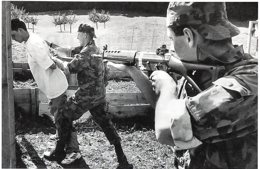
Auf die Ausbildung der Durchsuchung einer verdächtigen Person wird grosser Wert gelegt.