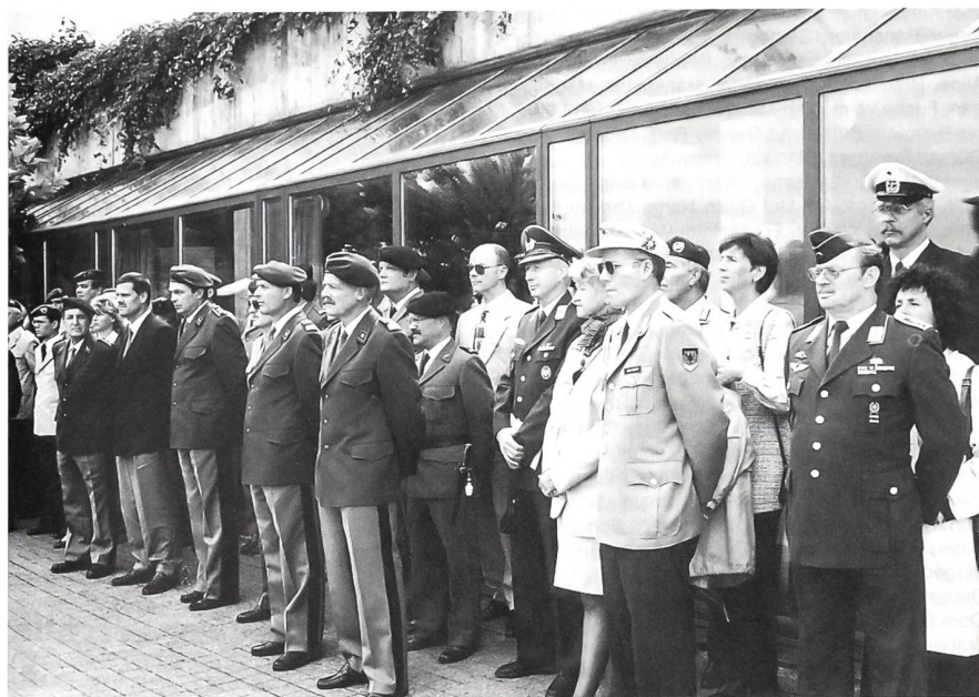
Die Teilnehmer der vierten Internationalen Bodensee-Militär-Reunion beim Fahnenaufzug.

Bourbaki-Panorama, Löwenplatz, 6004 Luzern Geöffnet So – Sa: 10 bis 16.30 Uhr ab März 9 bis 17 Uhr November, Dezember geschlossen