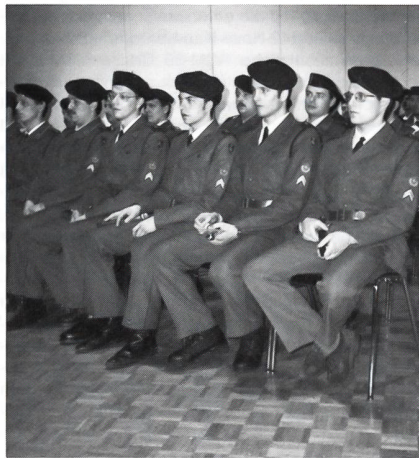
Zufrieden, den technischen Lehrgang mit Erfolg abgeschlossen zu haben.

« Sie haben hier das theoretische Rüstzeug erhalten, um dann im praktischen Dienst ihr Wissen in Taten umzusetzen. Bei ihrem Verband werden sie als Werkstattchef oder Systemspezialist erwartet und können dort das Gelernte mit Erfahrungen ergänzen und vertiefen. Selbstverwirklichung und Selbstüberwindung werden ihren Weg in die Zukunft begleiten. Als Chef werden sie besonders gefordert sein, Ihre Vor-