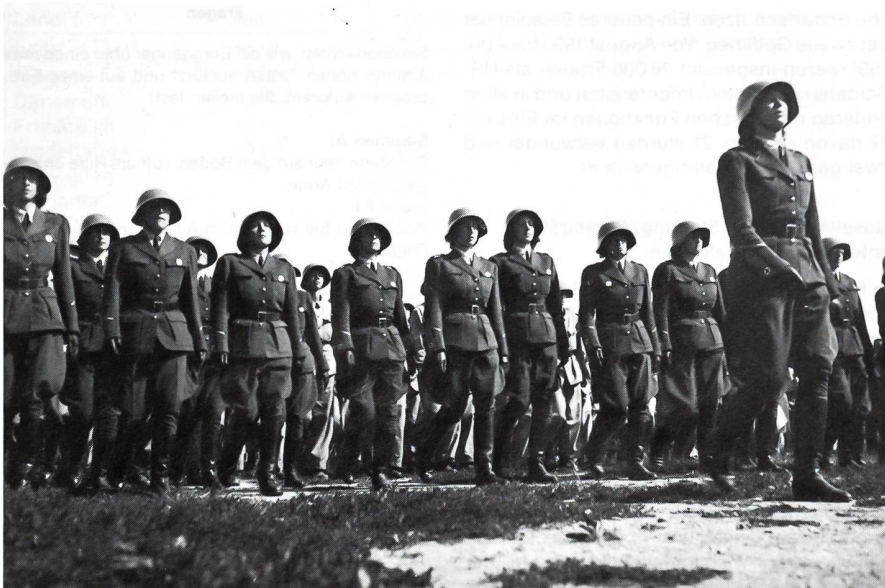
Défilé vor dem Oberfeldarzt

Montag, 1. Juli 1940: Die Eidg. Behörden ermahnen zum Sparen mit allen Lebensmitteln und verfügen Massnahmen zur Einsparung von Kraft- und Brennstoffen. Es darf nur noch 24stündiges Brot verkauft werden.