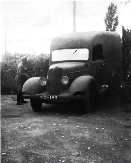
Die franz. Ambulanzen

Dienstag, 6. August 1940: Bei uns wird die kommunistische Partei verboten. Explosion eines französischen Munitionszuges in Miramas; 1000 Eisenbahnwagen zerstört.