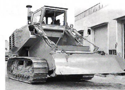
Schürfraupen Die wirtschaftliche Methode für Massenbewegungen

CH-8401 WINTERTHUR Tel. 052-213 30 23 Fax 052-213 00 29 D-78224 Singen D-13156 Berlin A-6900 Bregenz Rundstrasse 25 Aus dem Ausland: Tel. 0041-52-213 30 23 Fax 0041-52-213 00 29