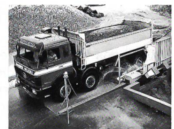
MOBY DICK Reifenwaschanlagen und Radreinigungsanlagen für LKWs