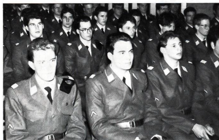
Die Unteroffizierschüler in Erwartung ihrer Beförderung zu Korporalen.

Am Freitag, 24. Februar 1995, war es soweit. Nach 6 Wochen intensiver Ausbildung, oft bis in den späten Abend und nach einer 3 Tage dauernden Führungsübung, der grosse Tag für die jungen Soldaten. Die Eltern der Uof-Schüler waren da, Behördenmitglieder von Oberglatt, das Regionalfernsehen und Presseleute. Ein ad-hoc-Spiel, zusammengesetzt mit Bläsern aus 16 Gemeinden, unter der Leitung von Walter Harlacher, bestritt den musikalischen Teil der Feier.