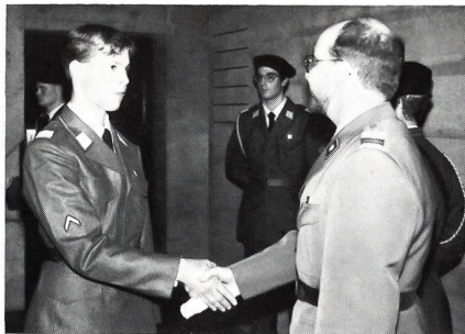
Blick und Handschlag.