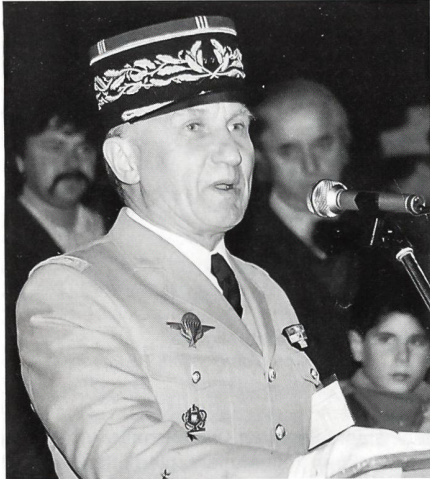
Brigadegeneral Rémy Simonet (Fra), CISM-Delegierter bei der Eröffnungsansprache.

Im «Schweizer Soldat» vom Mai 1995 berichteten wir über die 37. CISM-Skiweltmeisterschaft vom 21. bis 26. März. Im Rückblick zeigen wir eine Auswahl von Bildern von der Begrüssung und Rangverkündigung.