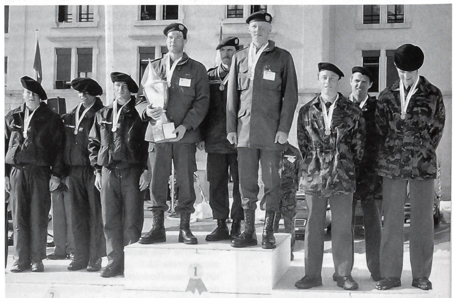
Die Sieger der Mannschaften «Triathlon» Herren