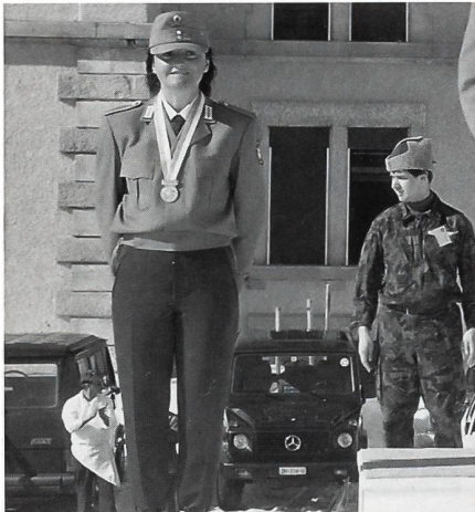
Die ersten Damen im Riesenslalom: von links, StUffz Christine Meier-Höck (D) 2., Uffz Hilde Gerg (D) 1. und Sdt Anna Ciesak (Pol) 3.