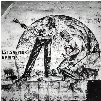
In den langen Jahren des Aktivdienstes entstand auch manches Kunstwerk.

Man war sich bald einmal einig, dass viele von diesen militärischen Anlagen aus dem einen oder andern Grund erhaltenswert sein könnten. Aber welche und mit welcher Begründung? Um dies zu beurteilen, muss man sich zuerst einmal einen Überblick, eben ein Inventar, verschaffen. Aber das ist bei der hiesi-