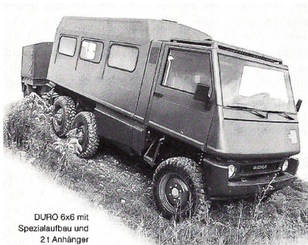
DURO 6x6 mit Spezialaufbau und 21 Anhänger

wegs um ein ausschliesslich militärisch nutzbares Fahrzeug handelt. Vielmehr sind dort auch Duro-Krankentransporter, Duro-Feuerwehrfahrzeuge oder zivile (Personen-)Transporter für den Einsatz auf der Strasse und in schwierigem Gelände zu sehen. Allein der Kundenwunsch entscheidet über den Einsatz des Fahrzeugs und dessen Aufbau.