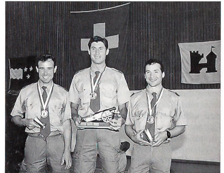
Die strahlenden FWK-Sommermeister 1996.