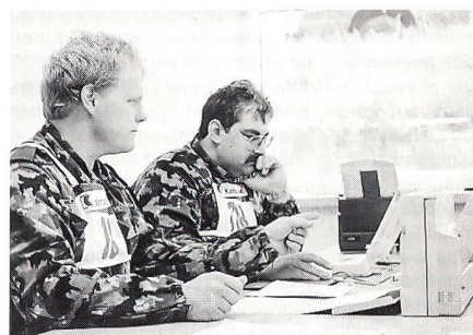
Büroweibel oder Feldweibel? Das neue EDV-Material.

Dass bei dieser Art von Feldweibeltreffen auch die Kameradschaft nicht zu kurz kommt, zeigte sich beim gemeinsamen Mittagessen im Truppengebäude des AMP Hinwil und beim Unterhaltungsprogramm, das die Zeit bis zur Rangverkündigung