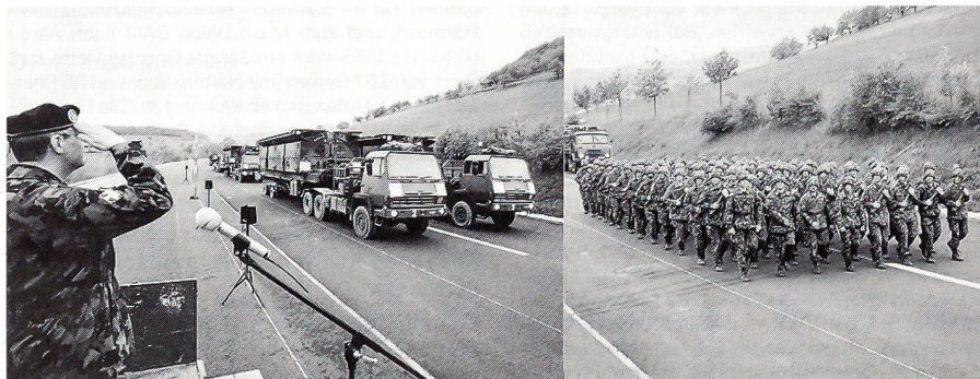
Oberst Brugger grüsst «seine» Genie-RS 56/96.

Emmen. (sda). Der Rüstungschef lud die Medien gestern zur Besichtigung der Endmontage bei der SF Schweizerische Unternehmung für Flugzeuge