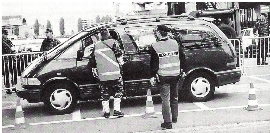
Zusammenarbeit Armee – Polizei: Fahrzeugkontrolle.