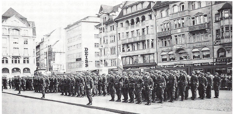
Das Füs Bat 99 auf dem Marktplatz in Basel.

Im Bereich der Zusammenarbeit des Grenzwachtkorps wurde der Assistenzdienst geschult. In der Umgebung des Chrischona-Turms auf der Riehener Höhe, unmittelbar der deutschen Grenze, wurden die WK-Soldaten von erfahrenen Grenzwachtbeamten beim Grenzeinsatz ausgebildet. Das korrekte Verhalten bei Verhaftungen von verdächtigen Personen wurde geschult. Während der Grenzwächter die Person abtastet und die Handschellen anlegt, sichert der Soldat mit der Schusswaffe das Umfeld. Das normale