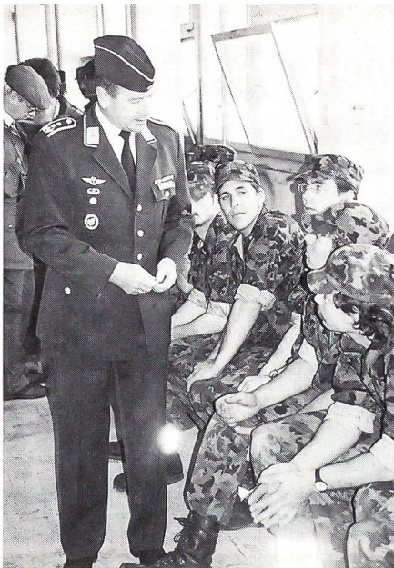
Oberst Krämer unterhält sich mit Basler Wehrmännern.

der Deutsch-Französischen Brigade aus Müllheim (D), Oberst Krämer, der Kommandant des Verteidigungsbezirkskommandos 53 aus Freiburg im Breisgau (D).