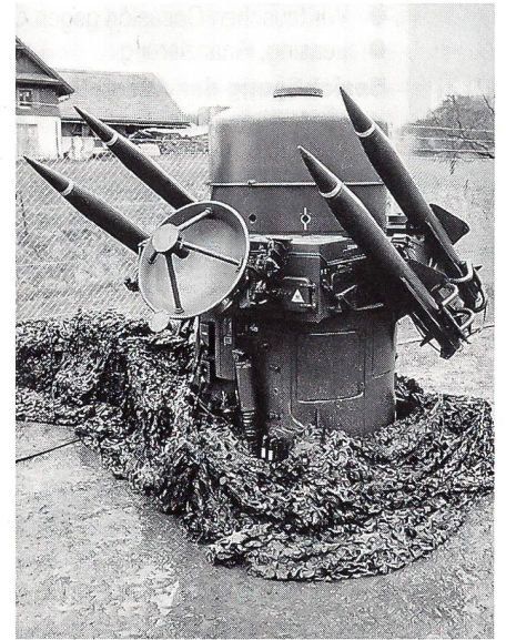
Das britische Lenkwaffensystem «Rapier» mit abschussbereiten Raketen ist auch in der Schweizer Armee in Aktion.

Schlussendlich bilden gewisse Luftfahrzeuge unrentable Ziele für die Fliegerwaffe. Soll man teure Luft-Luft-Lenk Waffen für die Bekämpfung von Drohnen und Marschflugkörpern