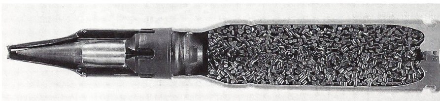
25 mm×137 mm-Treibspiegelgeschoss mit am Treibspiegelheck verankerter Patrone.