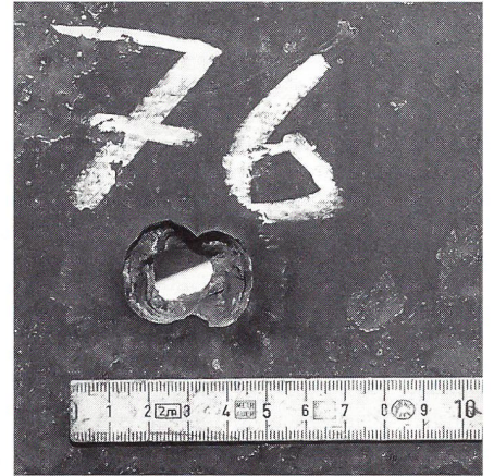
Einwandfreier Durchschuss in Panzerplatte.

Minute (n/min). Das durch die erwähnte Rotation stabilisierte Geschoss erreicht das Ziel auf einer relativ flachen Flugbahn. Die auftretenden enormen Fliehkräfte trennen die Kunststoffteile vom Kerngeschoss. Diese fallen als überflüssiger Ballast schon nach 40 Metern Flug zu Boden. Ausschlaggebend für die Zielgenauigkeit dieser Munition ist der rotations-symmetrische, zeitliche Verlauf dieses Trennvorganges. Das Gewicht der kompletten Patrone mit der Bezeichnung FAPDS 25×137 (Frangible Amur-Piercing Discarding Sabot Shell with Tracer) wird mit 500 gr angegeben. Die enorme Wirkung, die ein solches «Frangible-Geschoss» erzeugen kann, belegen die Werkfotos 3 und 4.