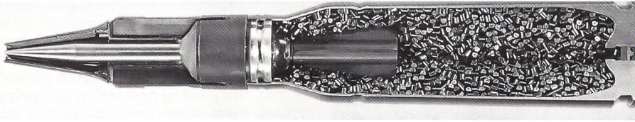
Pfeilgeschoss 25 mm x 137 mm mit verankerter Patrone. Diese, prall gefüllt mit Treibladungsmaterial.

Wuchtgeschosse mit einem Schlankheitsgrad bis 5,6 müssen drallstabilisiert werden. Pfeilgeschosse erreichen eine Mündungsgeschwindigkeit von 1350 m/s, sind windschlüpfriger und bringen daher mehr Aufschlagsenergiegedichte zum Ziel. Der weitere Aufbau dieses Munitionstyps gleicht jener der Treibspiegelgeschosse. Pfeilgeschosse können auch aus Rohren ohne eingearbeiteten Drall verschossen werden. Aber wegen der sauberen Trennung der Kunststoffteile vom Pfeil nach dem Mündungsaustritt, ist für kleinere Kaliber, zum Beispiel 20 bis 35 mm, zusätzlicher Drall erwünscht. Dies gestattet das Verschießen von Pfeil- und normaler drallstabilisierter Munition aus dem gleichen Rohr.