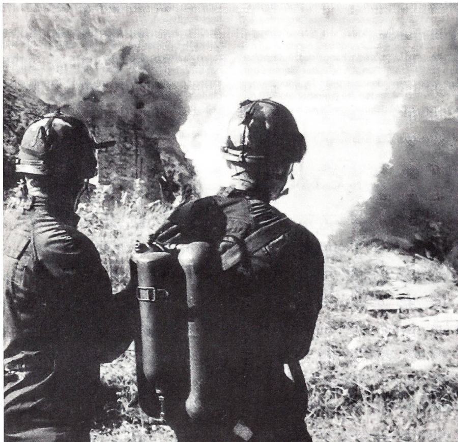
«Tir au lance – flammes pour ouvrir la voie aux fantassins.» Ausbildung der französischen Legionäre. Bild aus «armées d'aujourd'hui» Juli/August 1996.

Militärisch auftragsorientierte Überlegungen bestimmen die Ausrüstung der Militärpolizisten und Territorial-Füsiliere mit Schlagstöcken, Handschellen und Tränengasgewehren. Die Rechtsgrundlagen von der Bundesverfassung und vom neuen Militärgesetz sind dafür eindeutig. Hier gilt es den ideologisch getragenen politischen Versuch der Schwächung unserer Soldaten im Ordnungsdienst von «links» abzublocken.