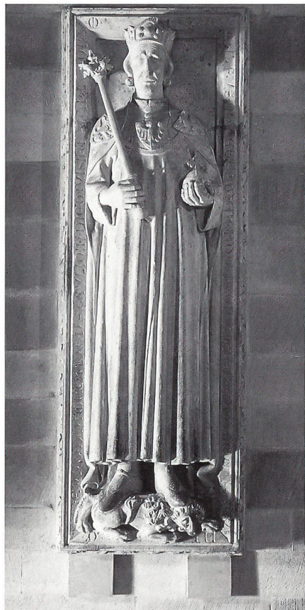
Grabmal Rudolfs von Habsburg im Dom von Speyer.

Zwar schlugen nahezu sämtliche militärischen Aktionen der Österreicher gegen die Schweizer fehl, so dass den Herzögen nichts