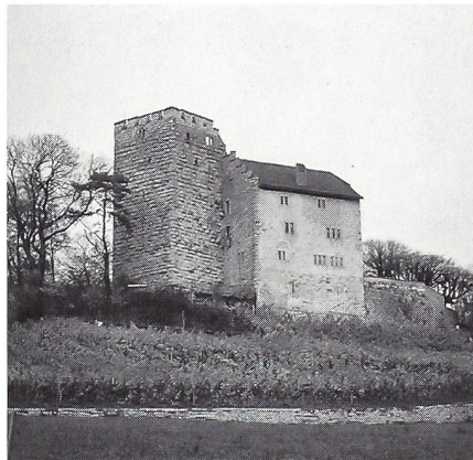
Die Habsburg von Süden.

Wie vollzog sich denn nun dieser Strukturwandel, der immerhin im Verlauf weniger Jahrzehnte ein Gesellschafts- und Wirtschaftssystem hinwegfegte, das einige hundert Jahre Bestand haben konnte. Auf der