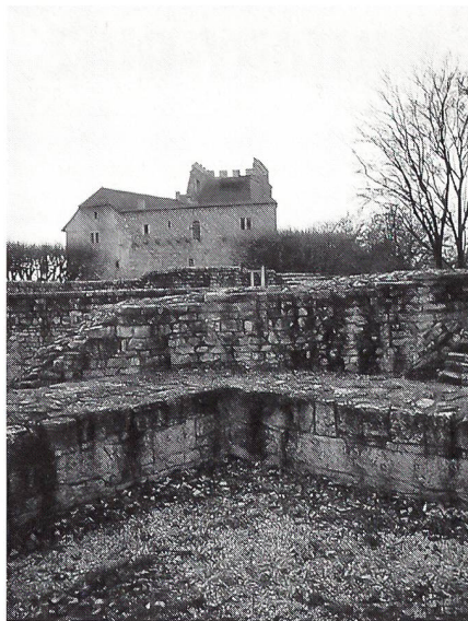
Die Burg von E mit den übriggebliebenen Fundamenten des Ost-Turms und des «Kernbaus».

anderes als eine politische Lösung des Konflikts übrigblieb, welche die Ansprüche der Habsburger de jure aufrecht erhielt, sie de facto aber bei den Eidgenossen verblieben. Das war für die Habsburger schon insofern wichtig, als dass es die Glaubwürdigkeit bei den Reichsfürsten unter allen Umständen zu wahren galt.