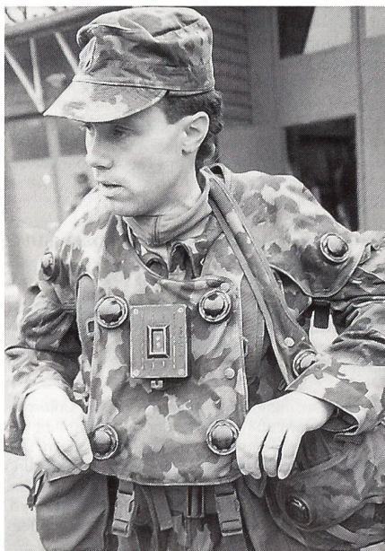
Sensoren am ganzen Körper zeigen feindliche Laserstrahlertreffer an.

Neu war der Einsatz von Stgw-Schiesssimulatoren: Jeder Kämpfer hatte auf seinem Stgw einen Laserstrahlender montiert; jeder trug auf einer Weste und auf dem Helm Sensoren, die jeden von einem gegnerischen Laserstrahl erzielten Treffer akustisch anzeigten – das penetrante Pfeifen konnte bis zum Ende der Übung nur durch Flachliegen des «Getroffenen» ausgeschaltet werden. So wirkte das Vorücken viel zeitgerechter – das einstmalige Drauflosstürmen weichte zB einem Zickzacklauf über die