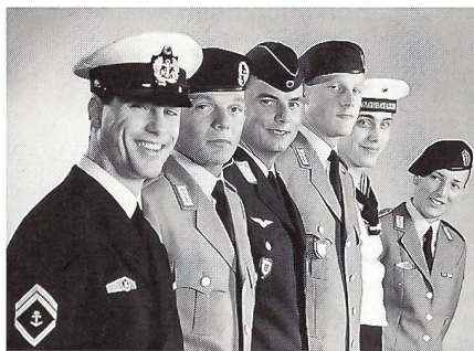
Unteroffiziere und Mannschaften der Teilstreitkräfte der Bundeswehr in ihren verschiedenen Ausgehuniformen und Waffenfarben, ganz rechts eine Sanitätssoldatin (Uffz/StUffz).

Ende der 80er Jahre wurde der Militärdienst der Frauen neuerliches Thema öffentlicher Diskussion, als die Opposition bezweifelte, dass der 1989 auf 18 Monate verlängerte Grundwehrdienst (Wehrpflicht) und geänderte Musterungs- und Tauglichkeitskriterien die Personalsorgen der Bw beheben könne. Die Argumente kanadischer Frauen, die Armee biete gesicherte Arbeitsplätze mit Aufstiegschancen und relativ gutes Einkommen, lieferte auch in der Bundesrepublik den Befürwortern anhaltend Diskussionsstoff. Wasser auf ihre Mühlen gaben auch die weiblichen Bewerbungen beim «Bund», wie die Bundeswehr im Volksmund vielfach genannt wird. Über die Jahre lagen dem BMVG jährlich 650 bis 700 Anfragen und Bewerbungen für die Offizierslaufbahn vor. Strikt «Nein» sagten hingegen Frauenorganisationen, kurioserweise auch solche, die für die Emanzipation der Frau stritten, sowie die Oppositionsparteien, mit Ausnahme der Freien Demokraten (FDP). Neben dem Verfassungsvotum mit einem Verbot des Waffendienstes für Frauen schien es damals illusorisch, in der politischen Landschaft eine parlamentarische Zweidrittelsmehrheit für eine Grundgesetzänderung –