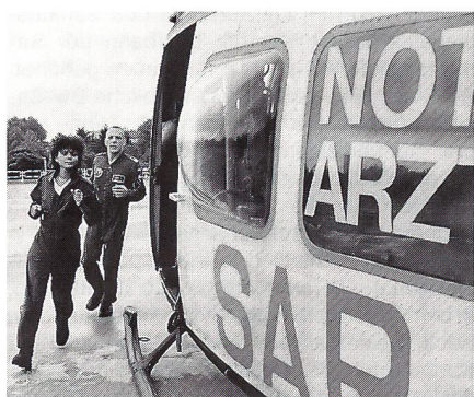
Die «gemischte» Notarzt-Besatzung des SAR (Search and Rescue-)Bereitschaftshubschraubers Bell UH-1D «Iroquois» des Rettungszentrums im Bundeswehrkrankenhaus Hamburg wird zum Soforteinsatz gerufen, Stabsärztin und Rettungsmeister (Ofw) spürten zur startbereiten Maschine, 13. 8. 1996.