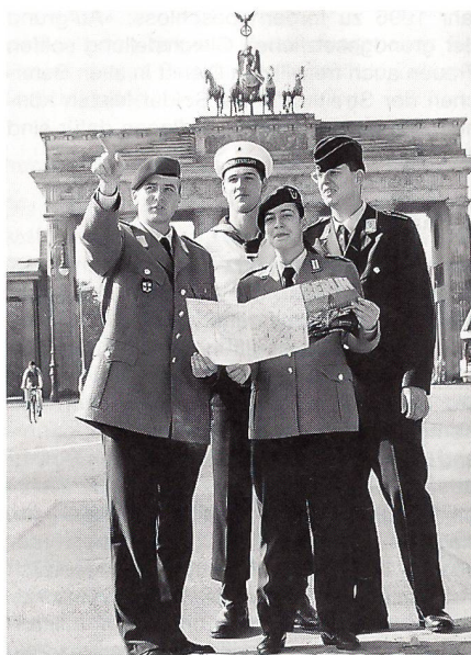
Bundeswehrosoldaten besuchen Berlin (von links: Heer, Marine, Luftwaffe), vorn eine Sanitätssoldatin des Heeres.

über den Sanitätsdienst hinaus – zu erwarten. Das Argument, viele weibliche Auszubildende würden in mehr als 30 Berufen – vom Kfz-Schlosser bis zum Flugzeugmechaniker – in den Bw-Lehrwerkstätten ausgebildet, hatte wenig Durchschlagskraft. Auch das BMVG wehrte mit Hinweis auf das freilich aus dem vorigen Jahrhundert stammende Kriegsvölkerrecht und den darin für alle anderen als den Sanitätssoldaten beschriebenen Kombattantenstatus einen weitergefächerten waffenlosen Dienst in Uniform ab, jeder militärische Einsatz sei – direkt oder indirekt – mit einem Waffeneinsatz verbunden oder könne Ziel einer rechtmässigen kriegerischen Handlung sein.