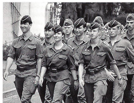
... Soldaten und Soldatinnen – im gleichen Schritt und Tritt – ein inzwischen alltägliches Bild in der Bundeswehr.

Geschichte der Frauen in der Armee einen wechselvollen und schicksalhaften Verlauf. Der Zweite Weltkrieg sah viele Millionen deutscher Frauen in Zivil in der Rüstungsindustrie, in Uniform als Wehrmächts-, Luftwaffen-, Nachrichten- und Technikerhelferinnen im Einsatz.