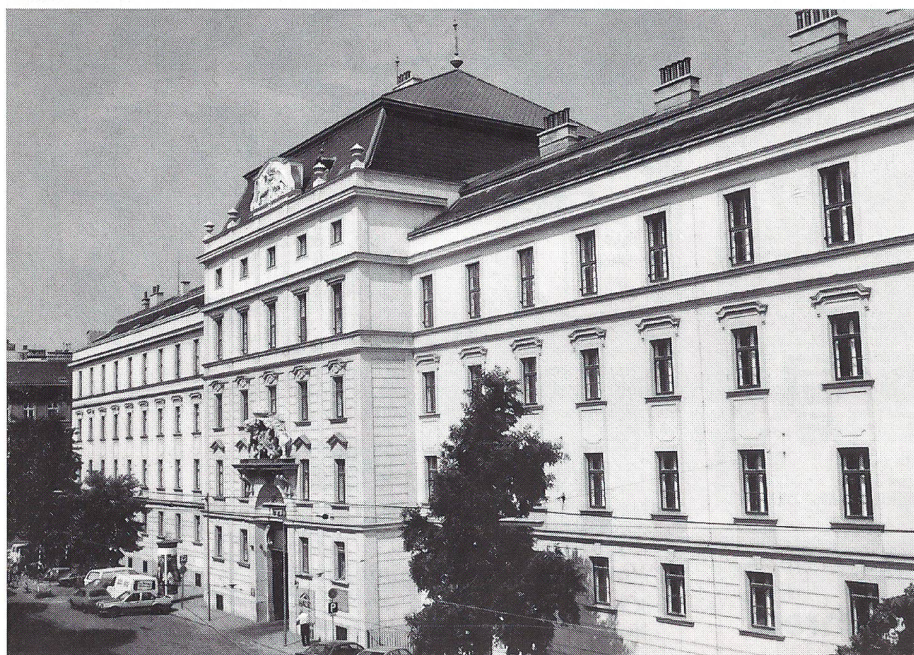
Hauptgebäude der österreichischen Landesverteidigungsakademie.

Faustus Furrer: Österreich mit seinen geistigen, künstlerischen und gestalterischen Leistungen hat uns Schweizern viel zu bieten. Der regelmässige Schulbetrieb der Akademie ermöglichte es mir und meiner Familie, das reichhaltige kulturelle Angebot geplant und ausgiebig zu erleben. Verschiedene Musicals sprachen bereits unsere schulpflichtigen